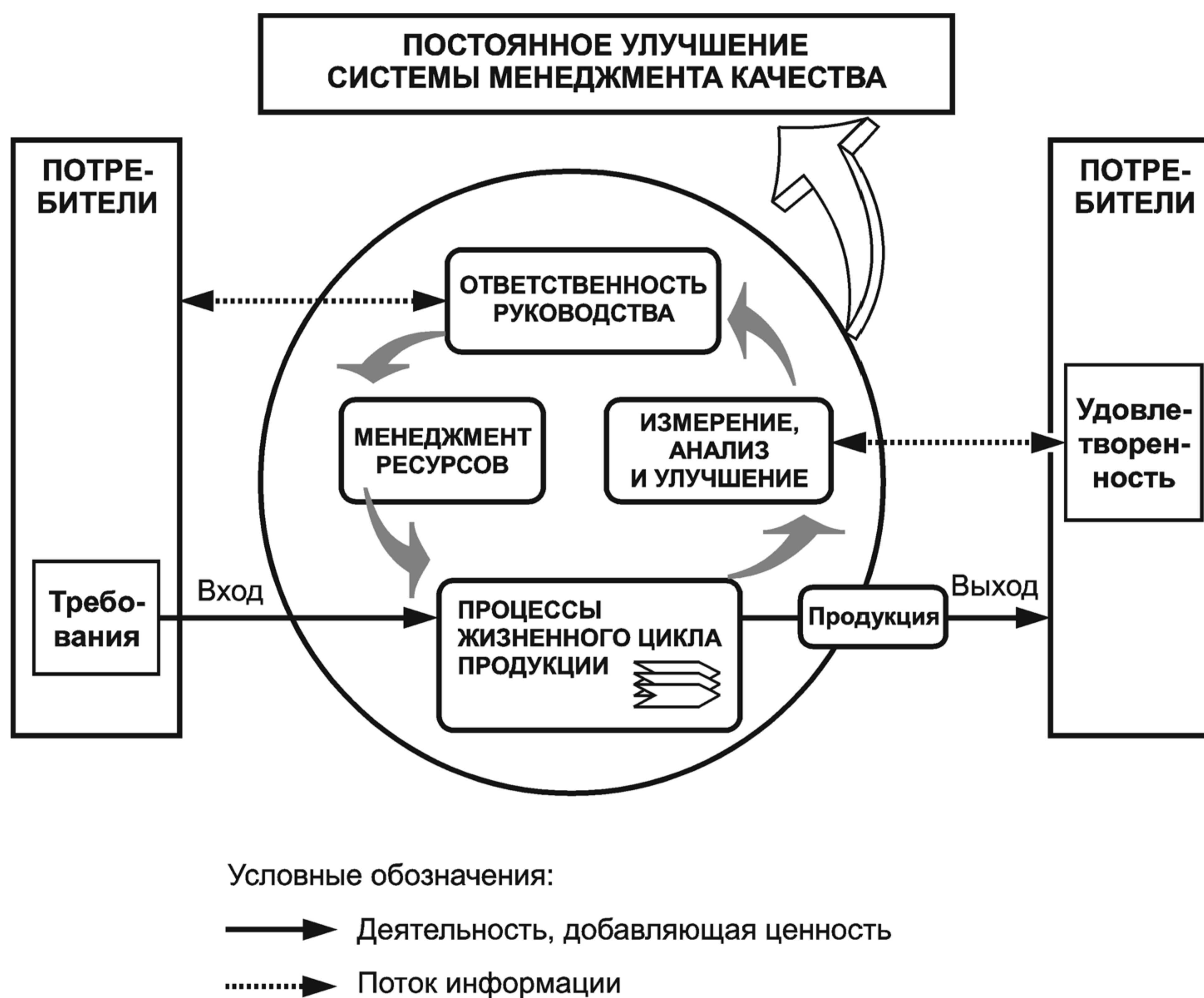
Рисунок 1 — Модель системы менеджмента качества, основанной на процессном подходе

Приведенная на рисунке 1 модель системы менеджмента качества, основанной на процессном подходе, иллюстрирует связи между процессами, представленными в разделах 4—8. Эта модель показывает, что потребители играют существенную роль в установлении требований, рассматриваемых в качестве входов. Мониторинг удовлетворенности потребителей требует оценки информации о восприятии потребителями выполнения их требований. Приведенная на рисунке 1 модель охватывает все основные требования настоящего стандарта, но не показывает процессы на детальном уровне.