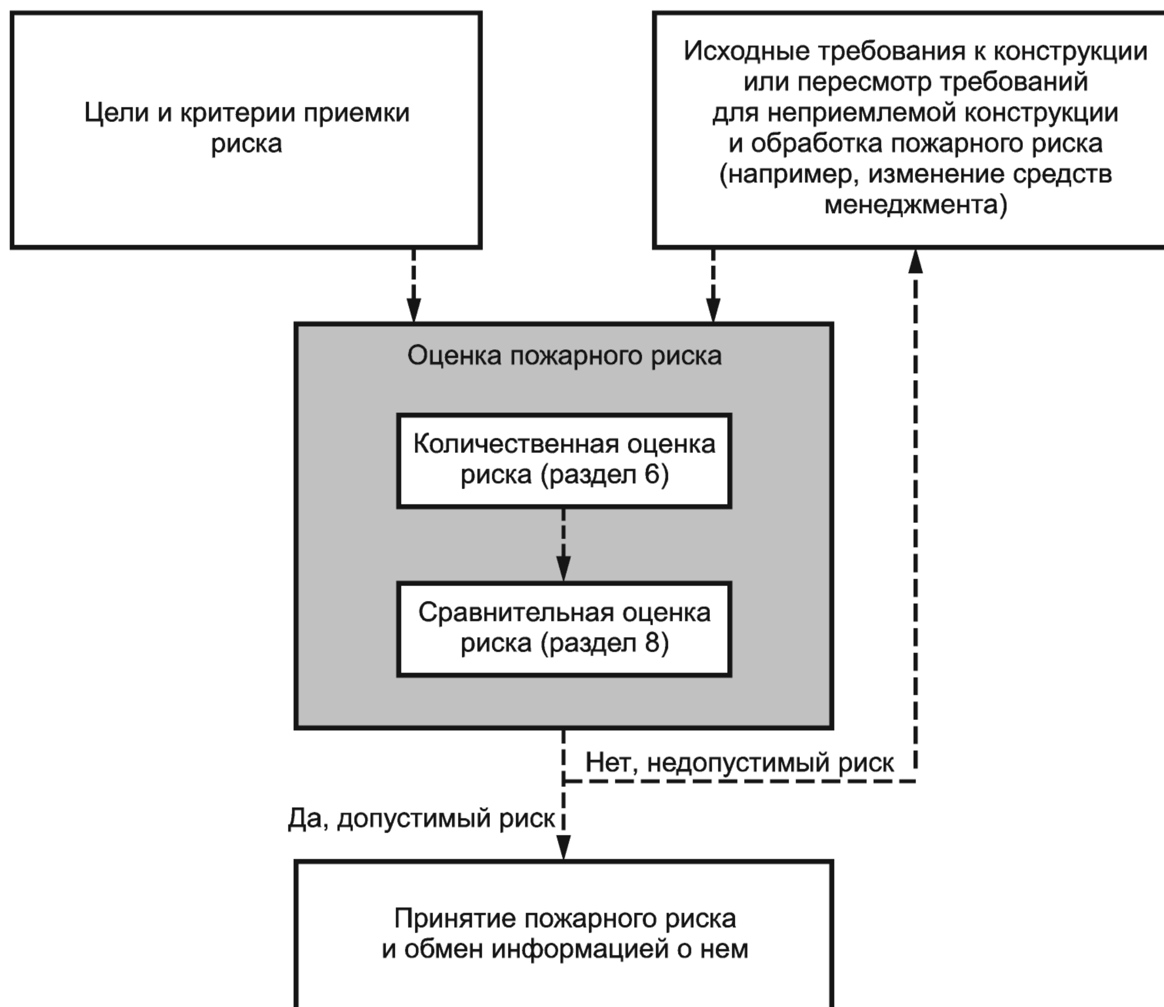
Рисунок 1 — Схема менеджмента пожарного риска

Менеджмент риска включает оценку риска, обработку риска, принятие риска и обмен информацией о риске. После обработки риска может потребоваться повторная оценка риска (см. рисунок 1). Оценка пожарного риска может также быть использована для оценки сценариев пожара альтернативных конструкций объекта защиты до выбора конкретной конструкции или внесения изменений в существующую конструкцию объекта защиты и направлена на достижение выполнения критериев допустимости и соответствия установленным требованиям.