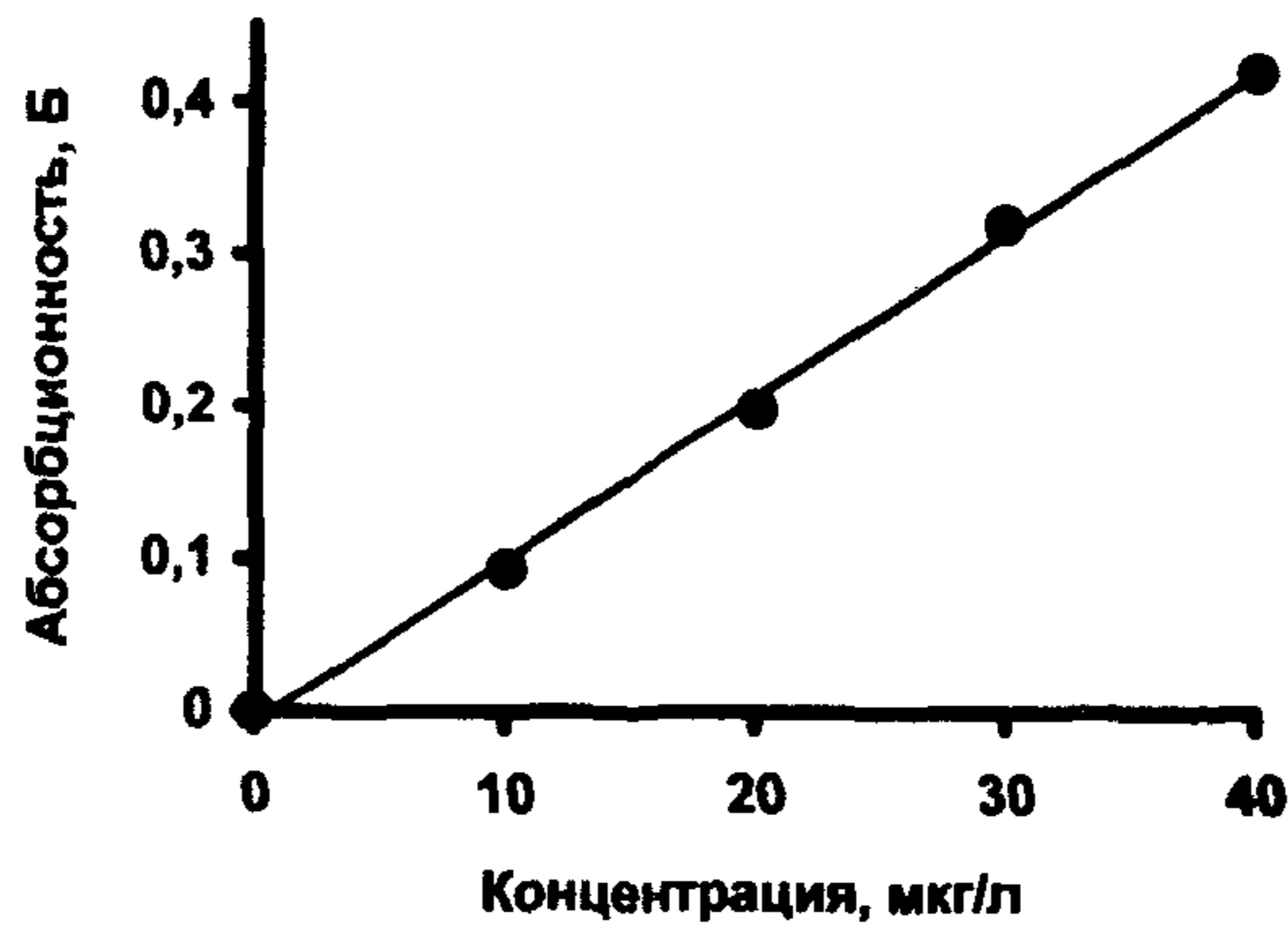
Рис. 2. Градуировочный график для определения свинца.

8.3.5. Стабильность градуировочной характеристики контролируют не реже, чем через каждые 20 анализируемых проб. Образцами для контроля стабильности градуировочных характеристик являются градуировочные растворы №№ 2 или 3, согласно табл. 8.3. Градуиро-